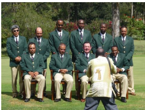
Tournoi de Pâques du Royal Nairobi Golf Club (2008)