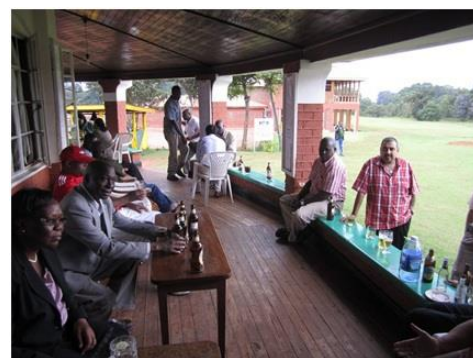
Terrasse du Kitale Club lors d'un tournoi de golf (2013)

A partir d'une enquête ethnographique au long cours, menée au Kenya dans les associations exclusives que sont les clubs, Dominique Connan questionne conjointement le legs institutionnel du colonialisme, la sociabilité des élites et la formation de l'État en Afrique.