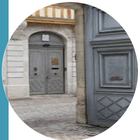
Le Jour ni l'Heure 5601 : Centre Rachi - synagogue de Troyes, Aube

http://unice.fr/inscription-reinscription/inscription