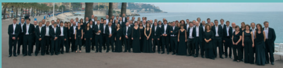
Orchestre Philharmonique de Nice